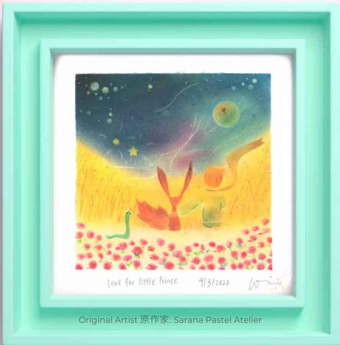
Original Artist 原作家: Sarana Pastel Atelier